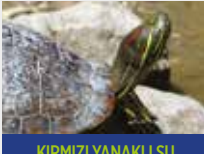
KIRMIZI YANAKLI SU KAPLUMBAĞASI

Türkiye'deki Karasal Ortamlarda ve İç Sularda İstilacı Yabancı Türlerin Oluşturduğu Tehditlerin Değerlendirilmesi Projesi