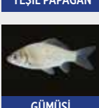
GÜMÜŞÜ HAVUZ BALIĞI